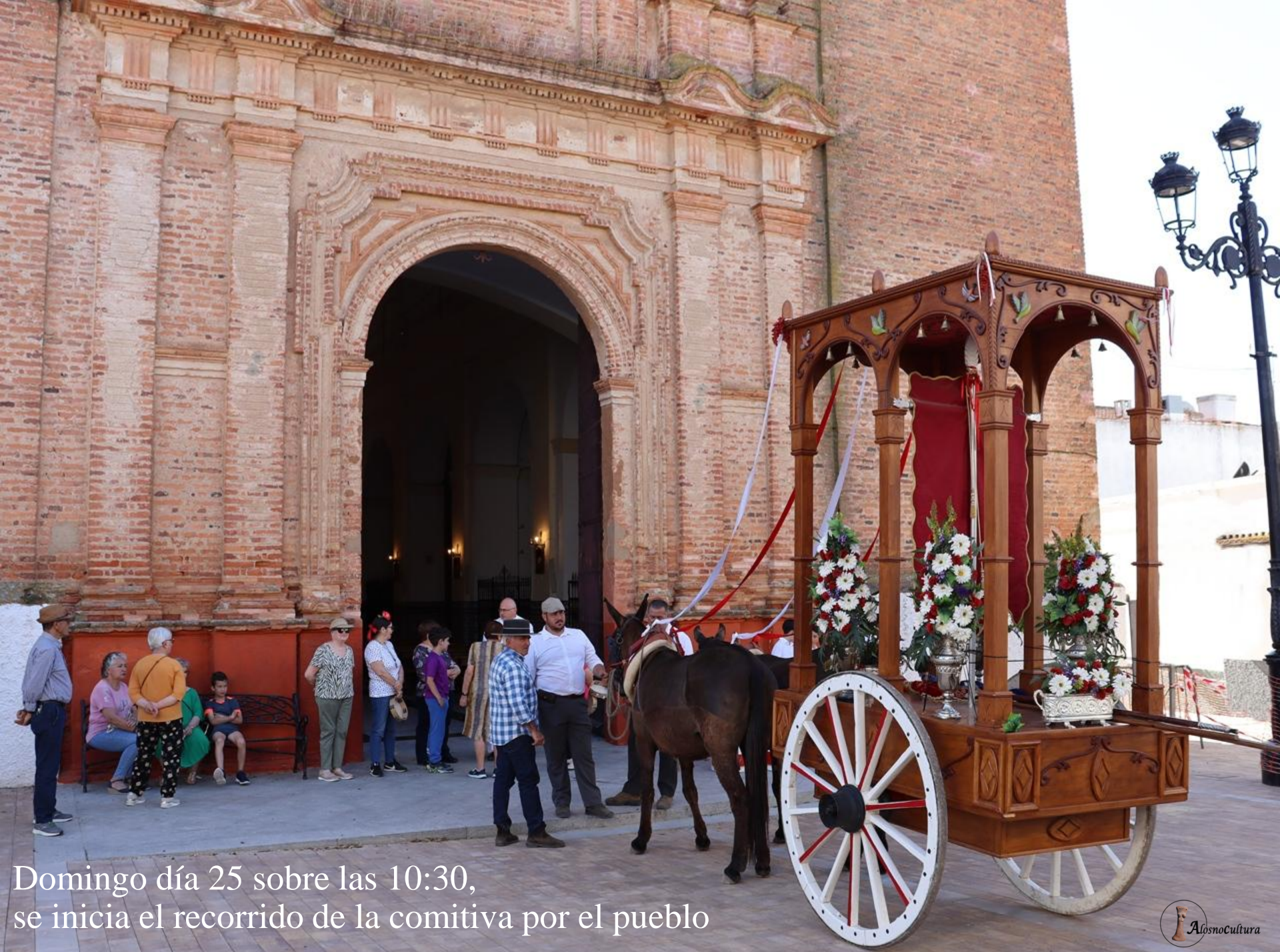
Domingo día 25 sobre las 10:30, se inicia el recorrido de la comitiva por el pueblo