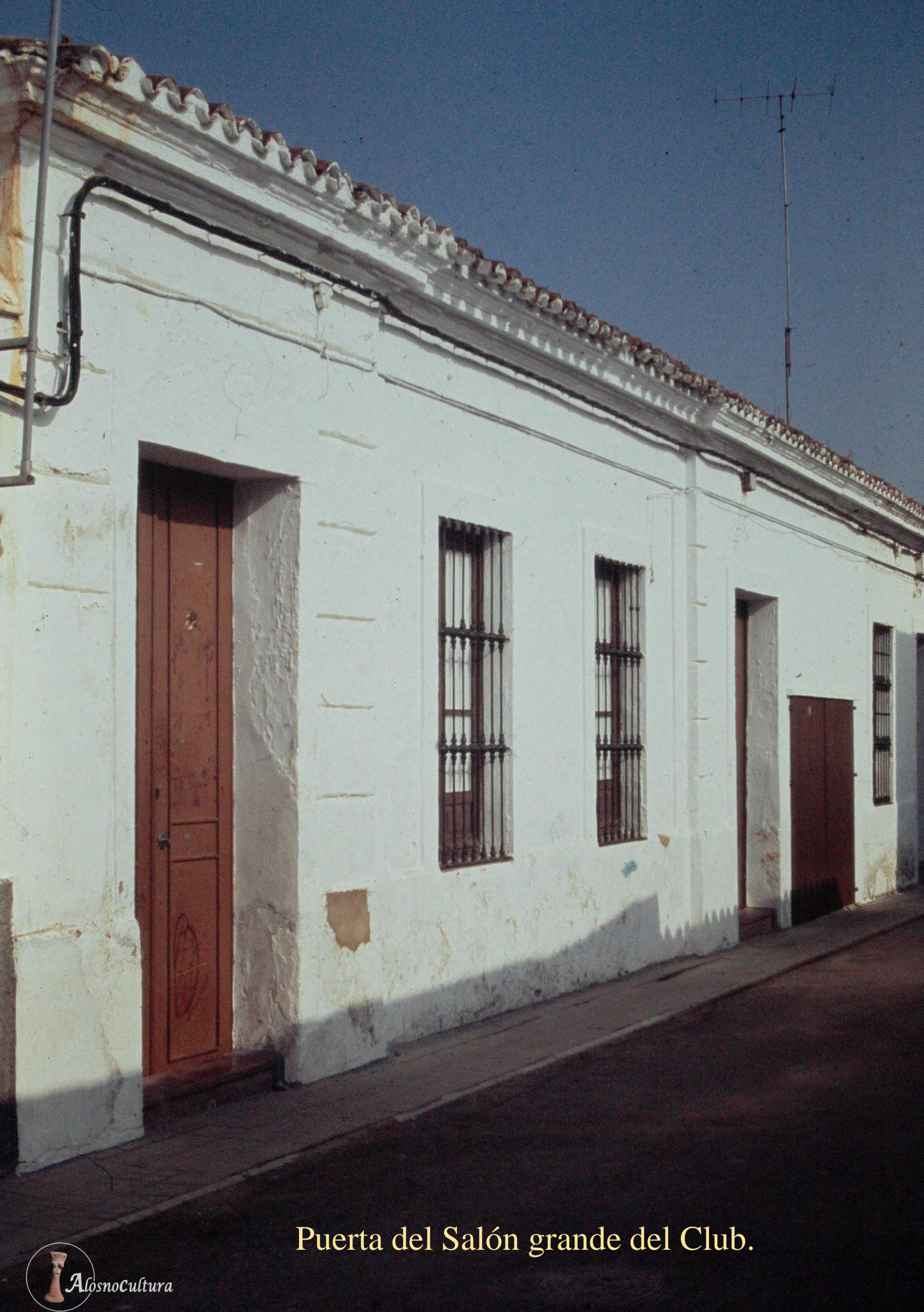
Puerta del Salón grande del Club.