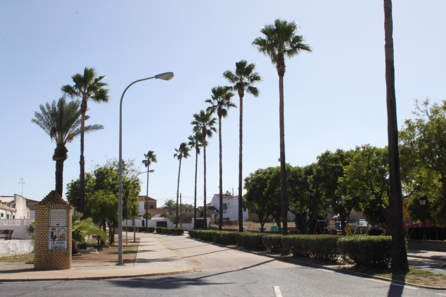
Avenida de Andalucía en la actualidad.