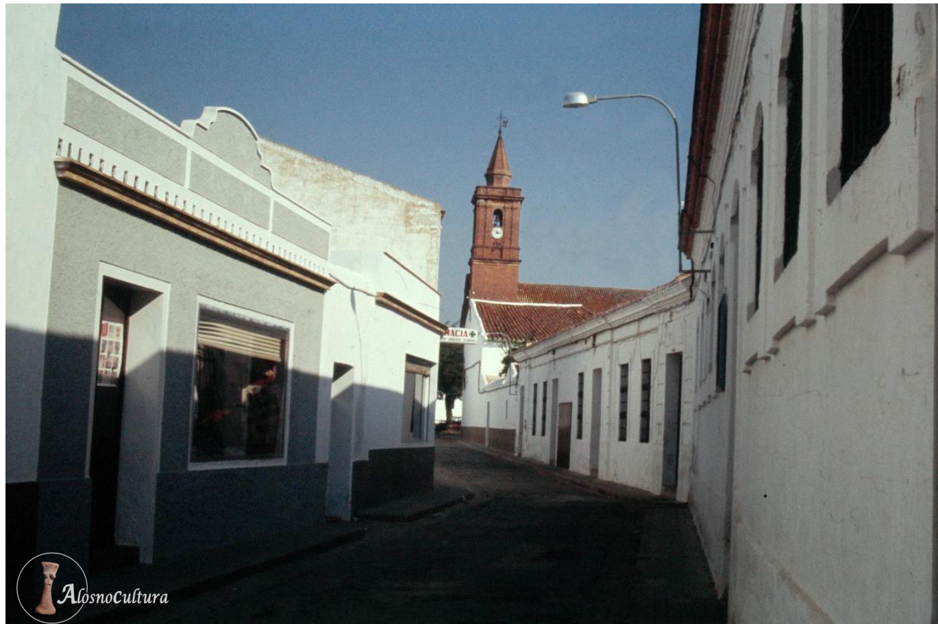
Antigua Calleja de la Plaza donde estaba el Club Juvenil