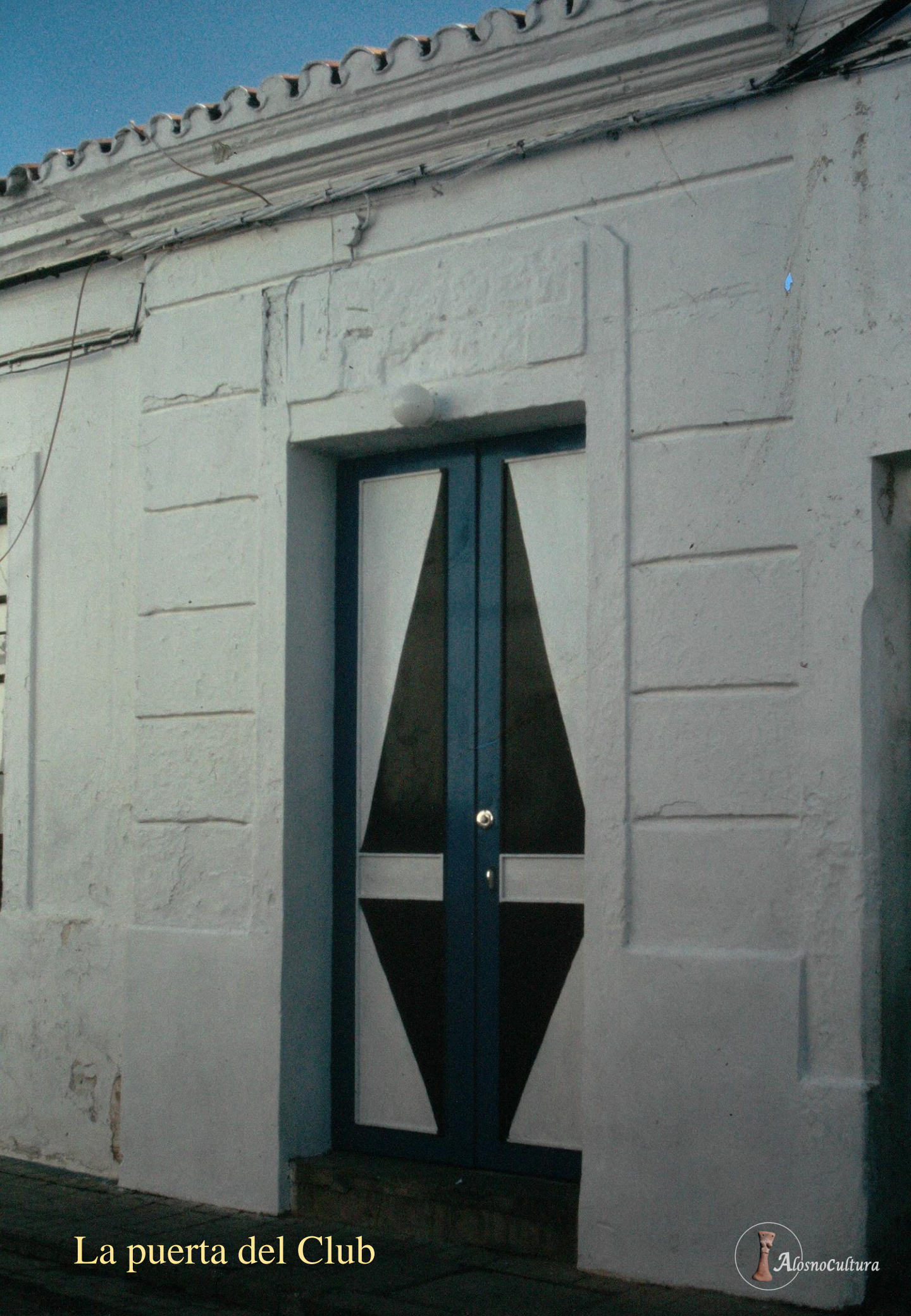
La puerta del Club