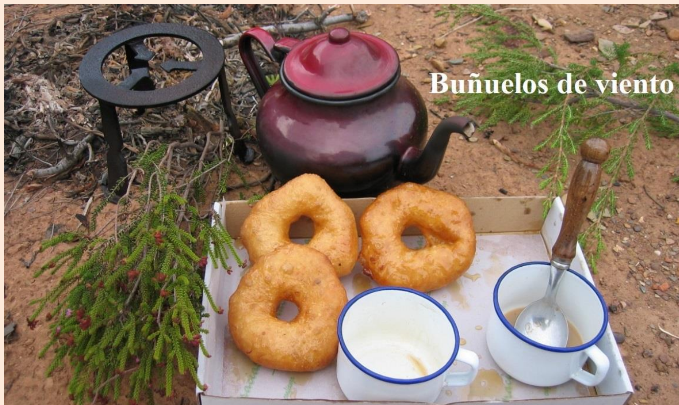
Buñuelos de viento