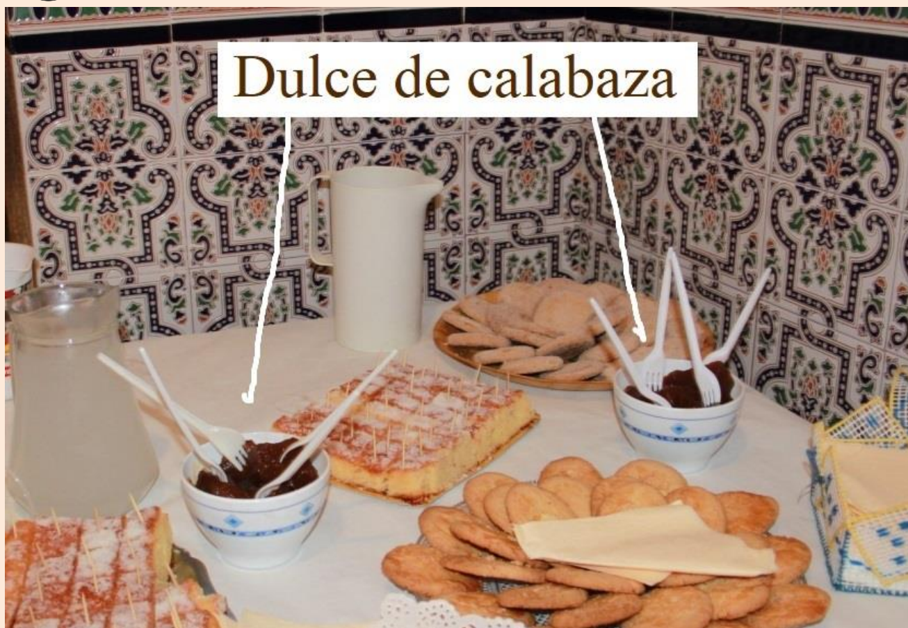
Dulce de calabaza