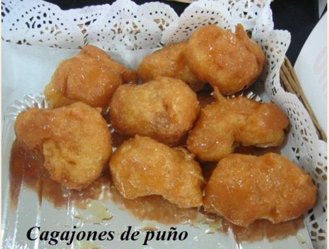
Cagajones de puño