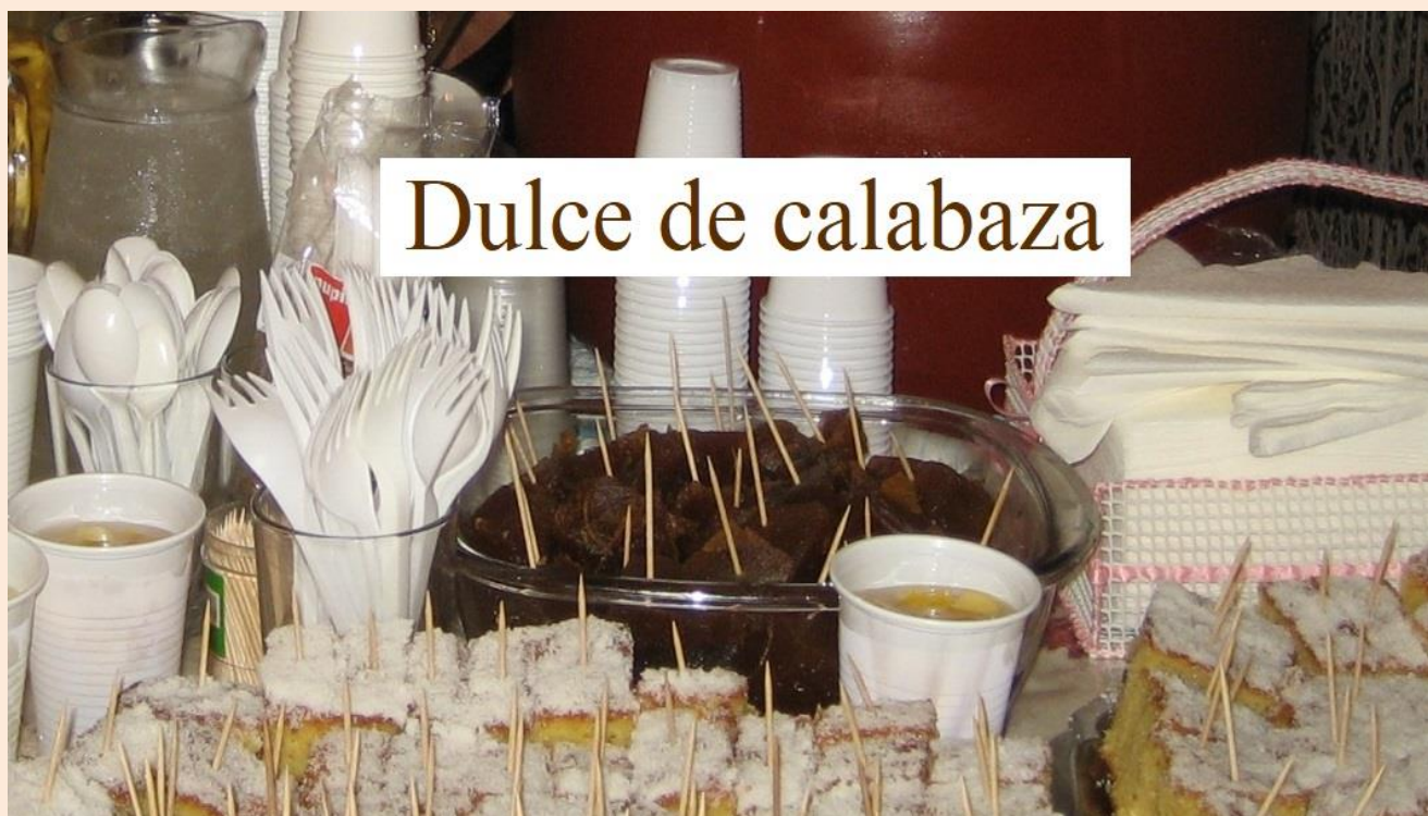
Dulce de calabaza