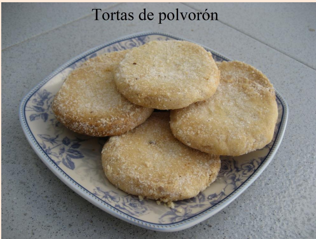
Tortas de polvorón