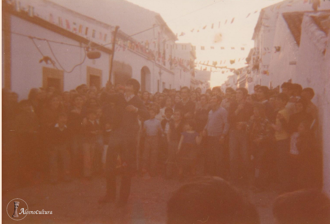
Piñatas con porrones y cántaros junto a la Taberna de Mateo al final de la calle Real. (años 80)