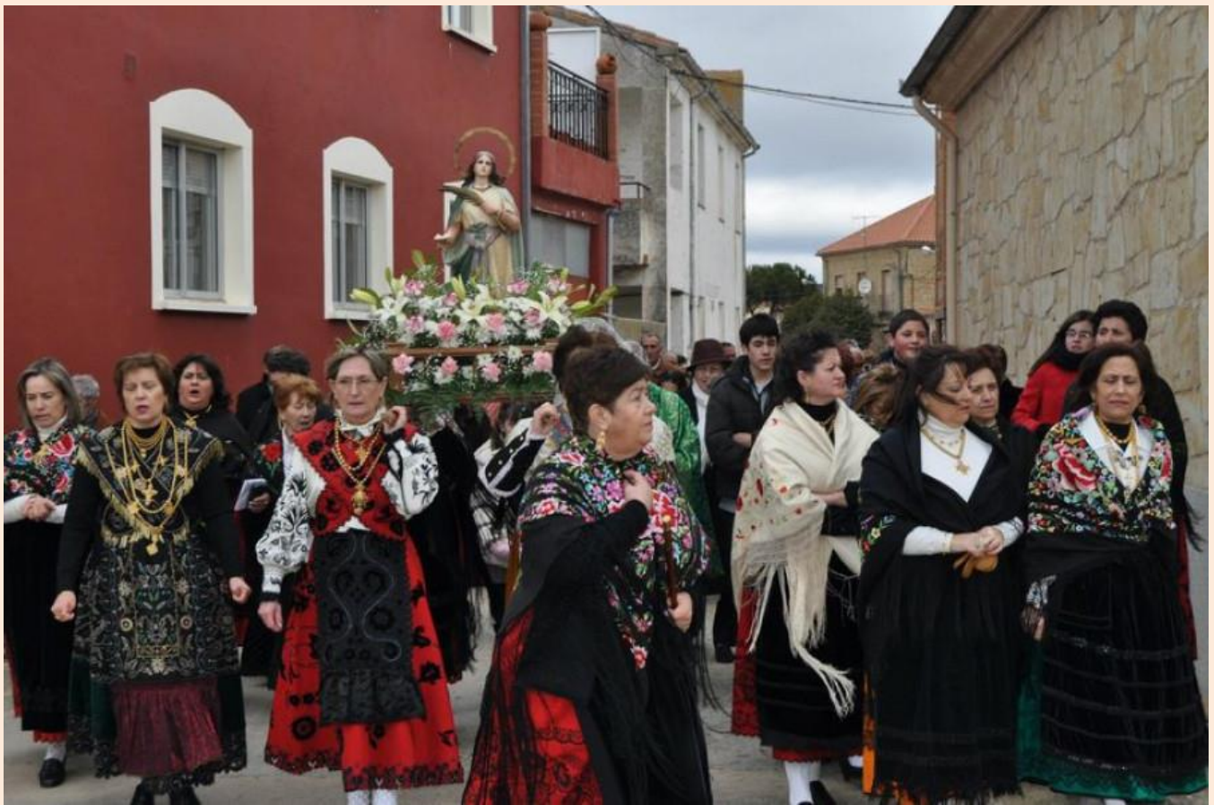
En la foto: celebración de Santa Águeda.

Las mujeres de la localidad de San Muñoz (Salamanca) también celebran su tradicional " Jueves de Comadres ".