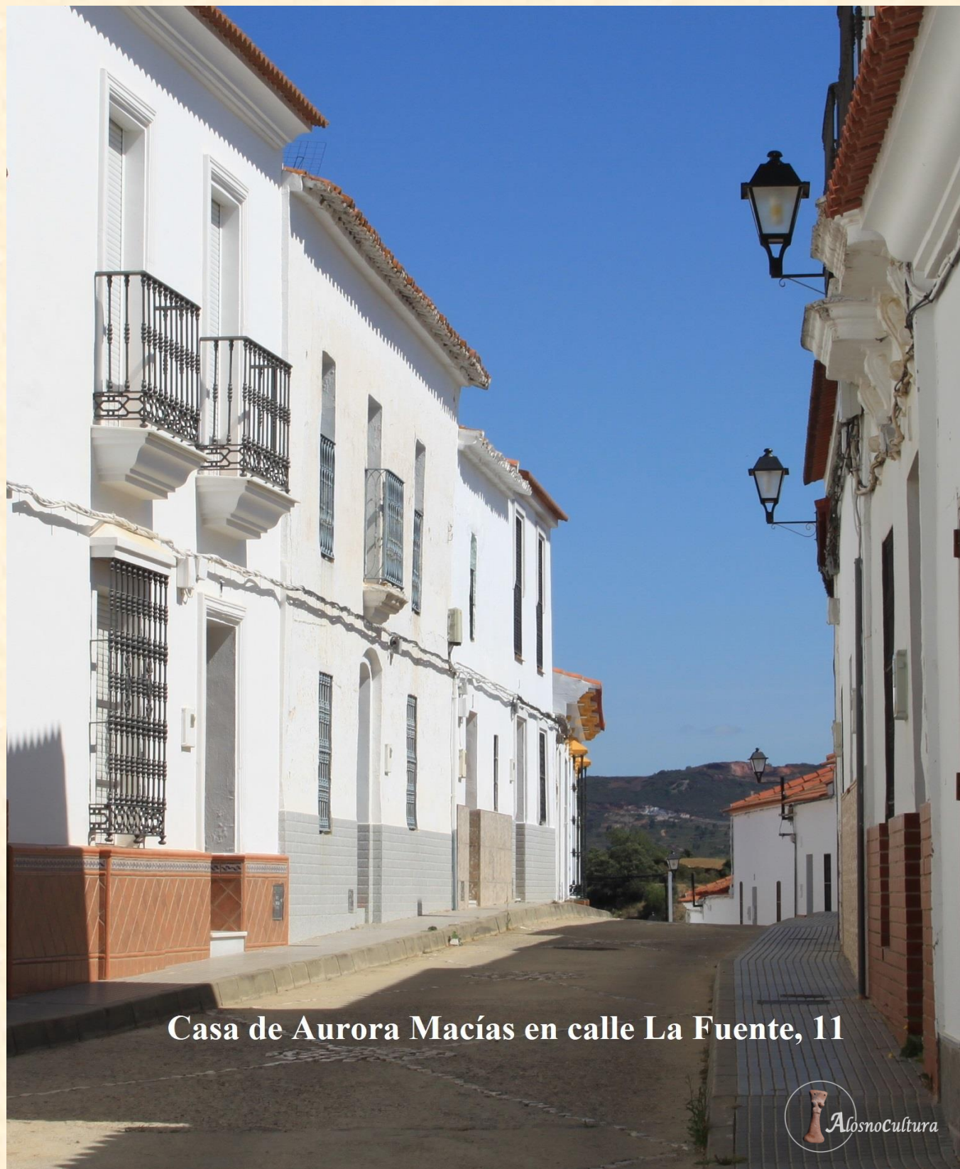
Casa de Aurora Macías en calle La Fuente, 11