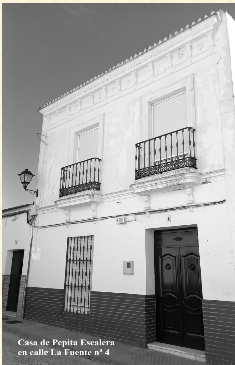
Casa de Pepita Escalera en calle La Fuente nº 4