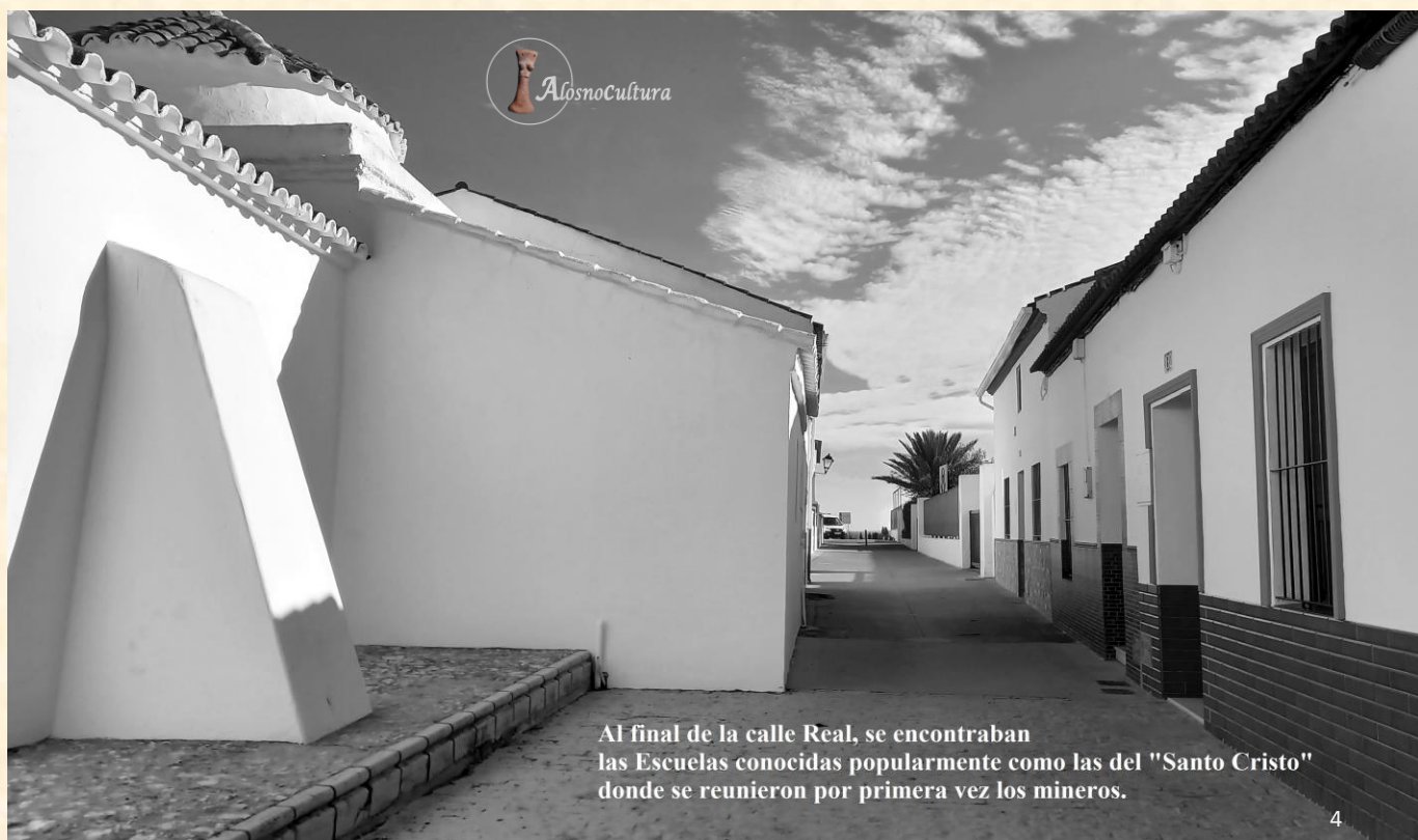
Al final de la calle Real, se encontraban las Escuelas conocidas popularmente como las del "Santo Cristo" donde se reunieron por primera vez los mineros.