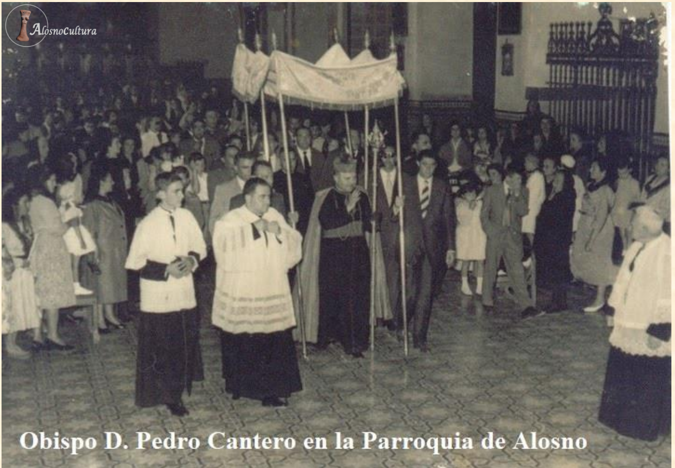
Obispo D. Pedro Cantero en la Parroquia de Alosno

Así aparecieron los sacerdotes obreros, las juventudes obreras católicas (JOC), las hermandades obreras de acción católica (HOAC) y otros muchos movimientos.