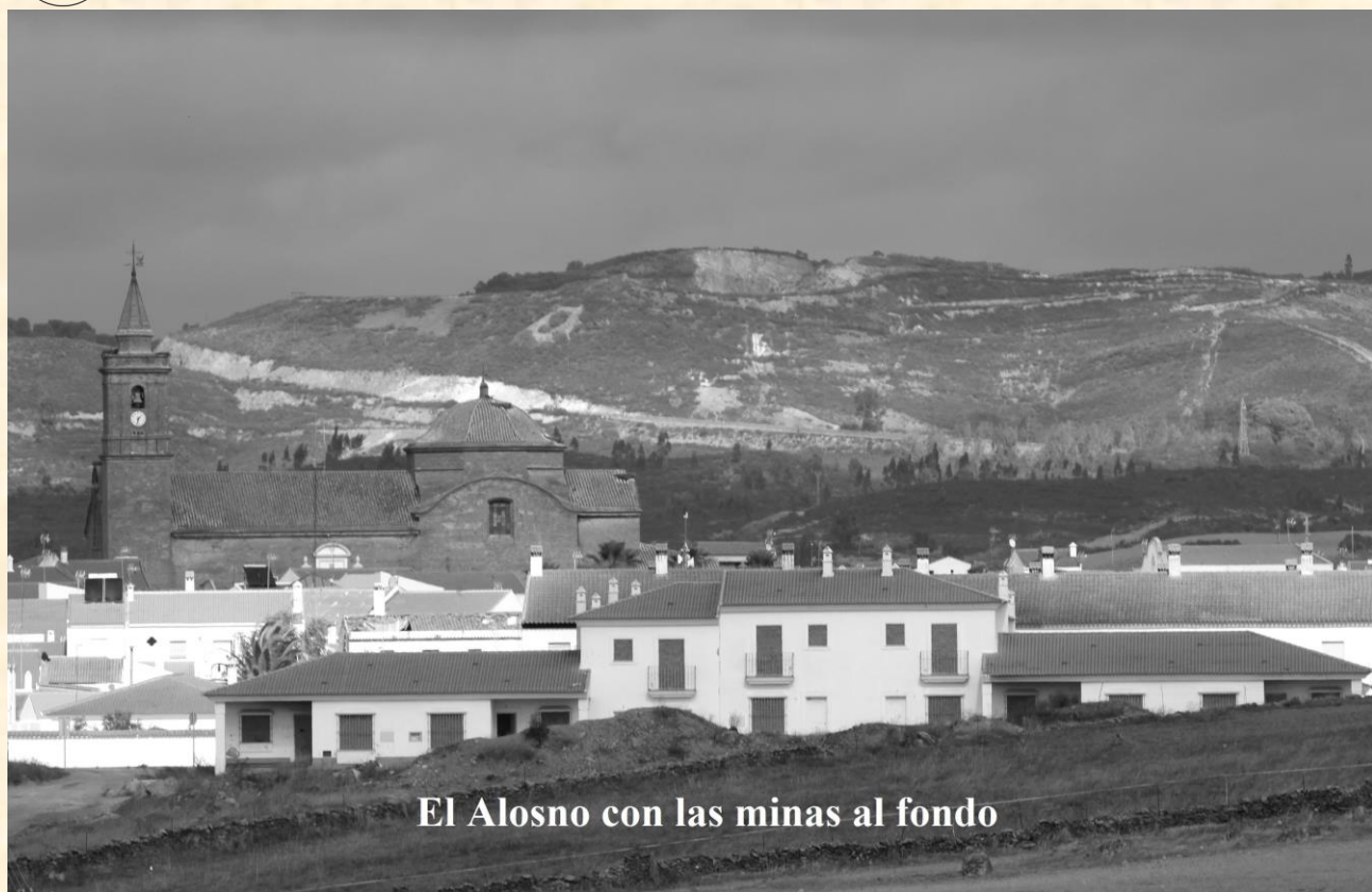
El Alosno con las minas al fondo