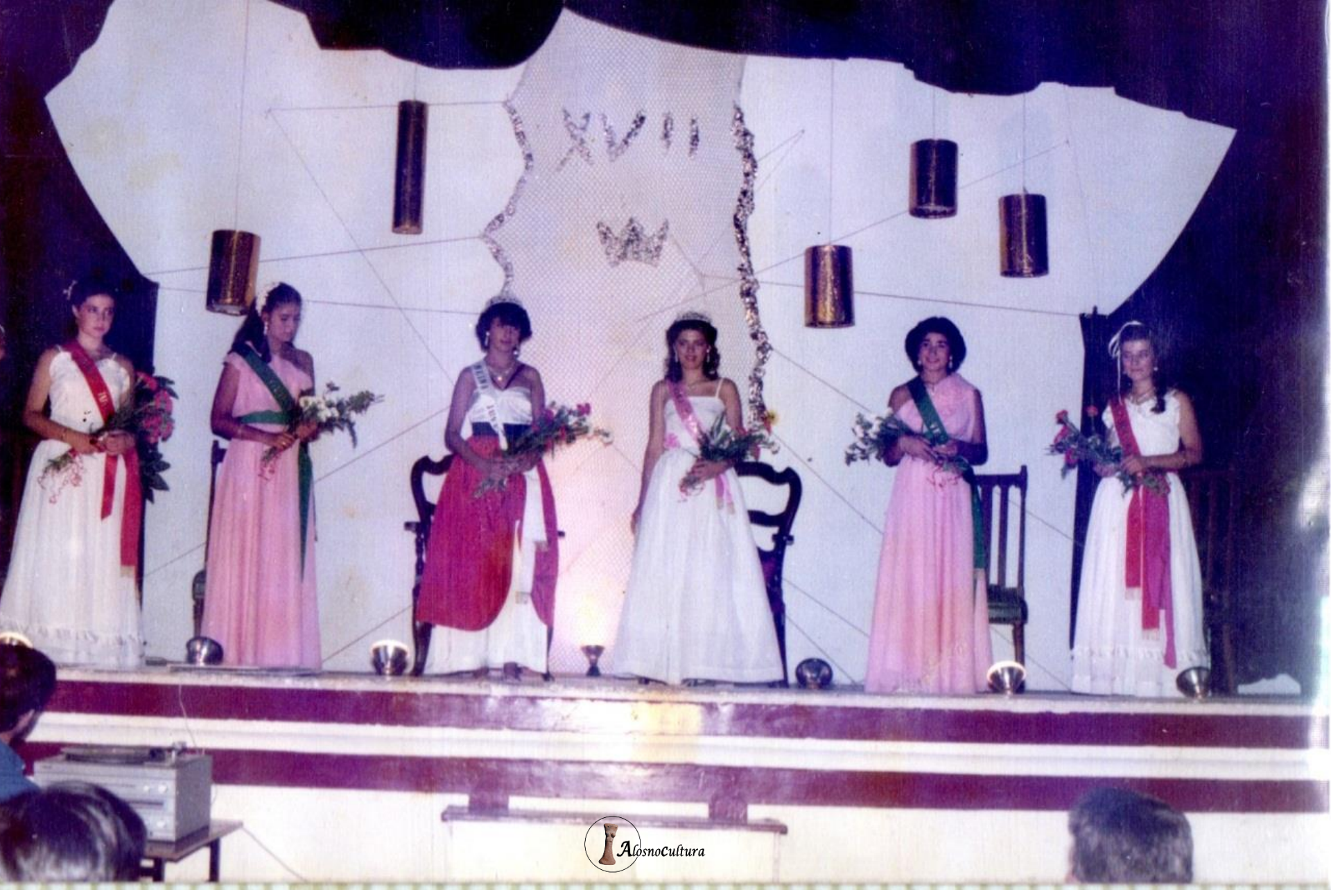
Coronación de la Reina de la Semana de la Juventud 1984