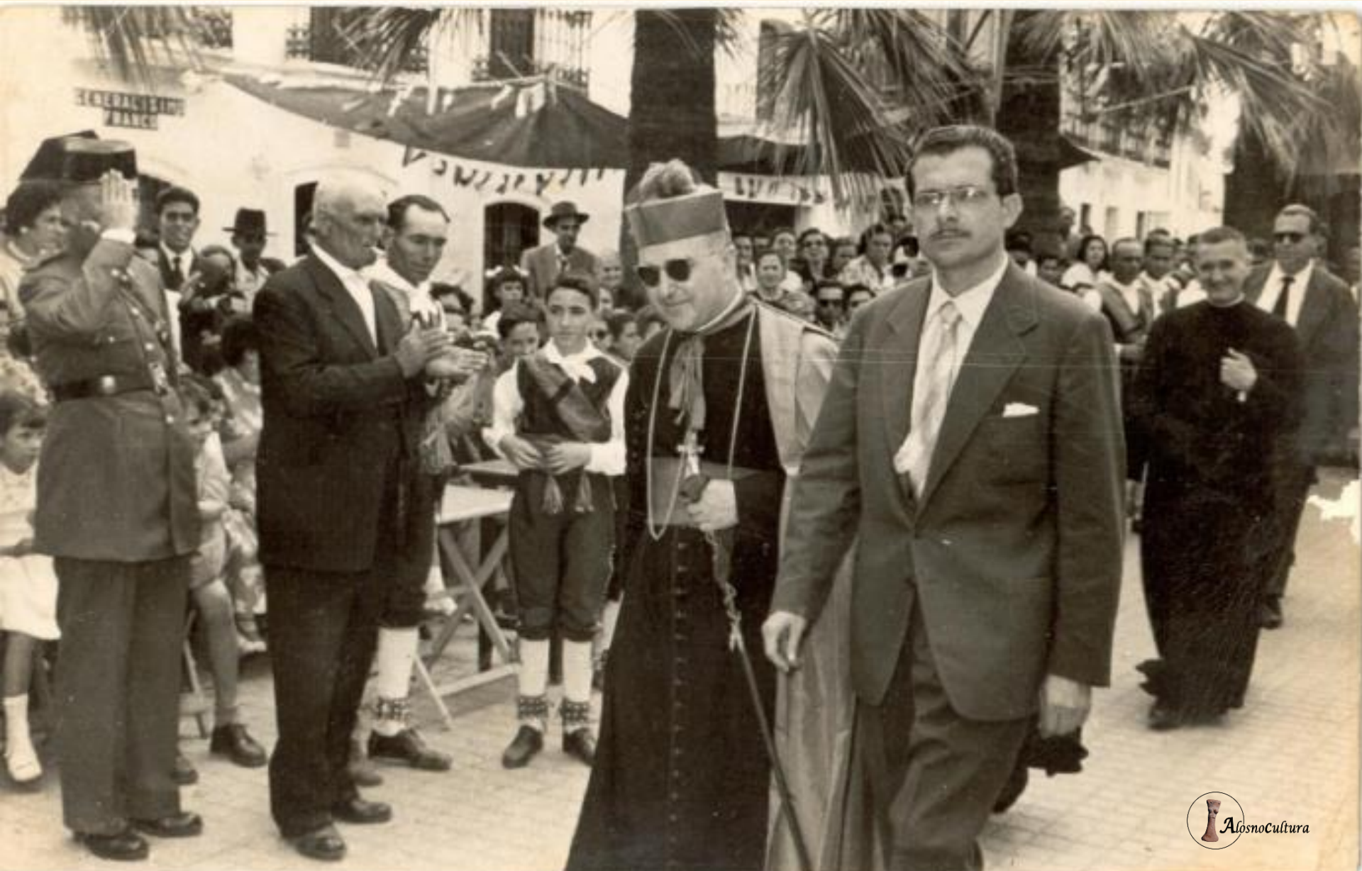
En Alosno, el Obispo de Huelva nos hizo una visita en la Fiesta de San Juan de 1956