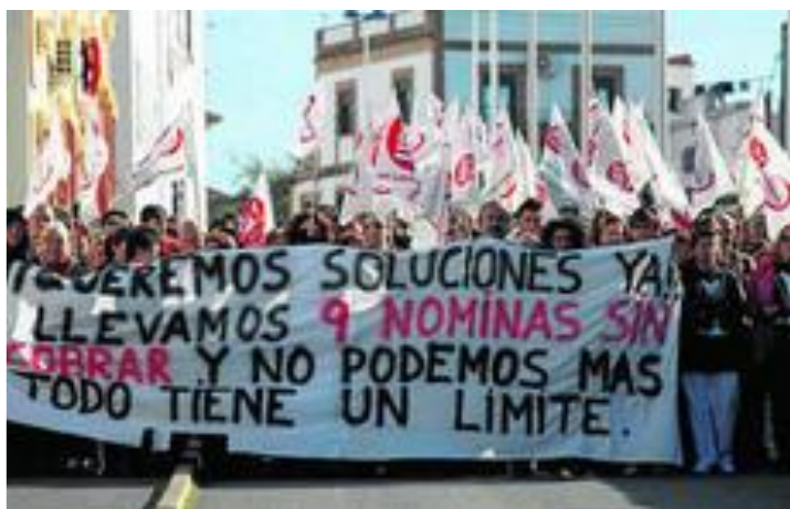
Protesta de los trabajadores, ayer en Alosno.

JORDI LANDERO / ALOSNO, ALOSNO | ACTUALIZADO 31.01.2012 - 05:01 -HUELVA INFORMACIÓN-