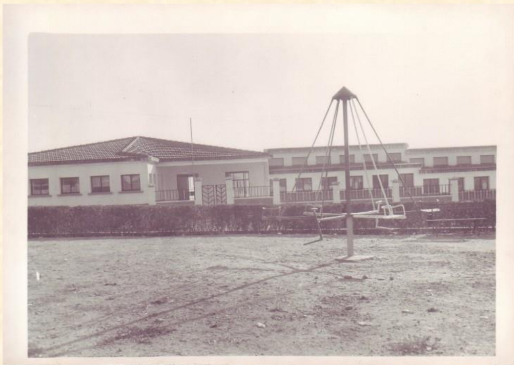
Parque infantil frente a la Academia Cervantes (Instituto) donde se construirá la Residencia.

Poco a poco íbamos concretando la OBRA SOCIAL (una residencia de ancianos). Mandamos hacer un proyecto a un arquitecto, vendimos las acciones y se vendió el piso-estudio de Madrid, bajo la tutela de la Junta y por subasta (creo que hubo cosas raras en la venta, pero no puedo demostrarlo. Se vendió (no supimos a quién) en ¿tercera subasta? El montante en dinero, una vez vendido estos bienes, se elevaba alrededor de 20 millones, con los que se pagó la obra.