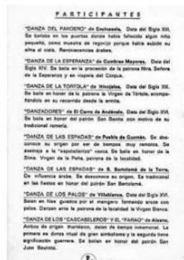
Participantes en 1974.