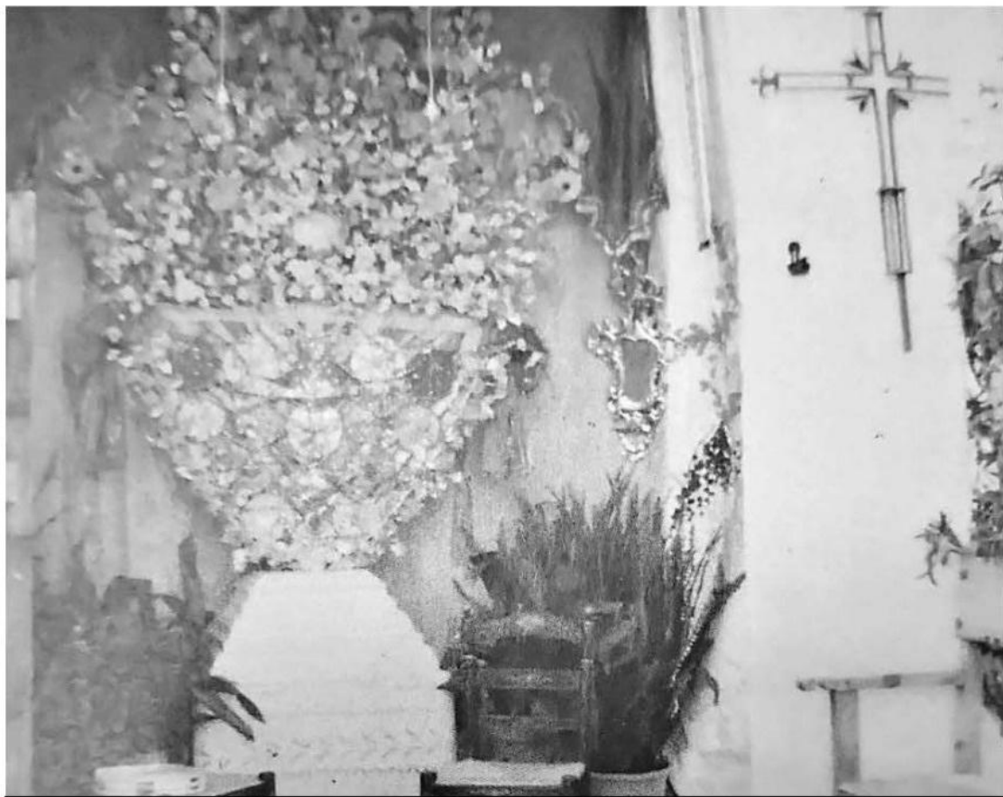
Cruz de la Calle Real que se incorporó al escenario de 1974.