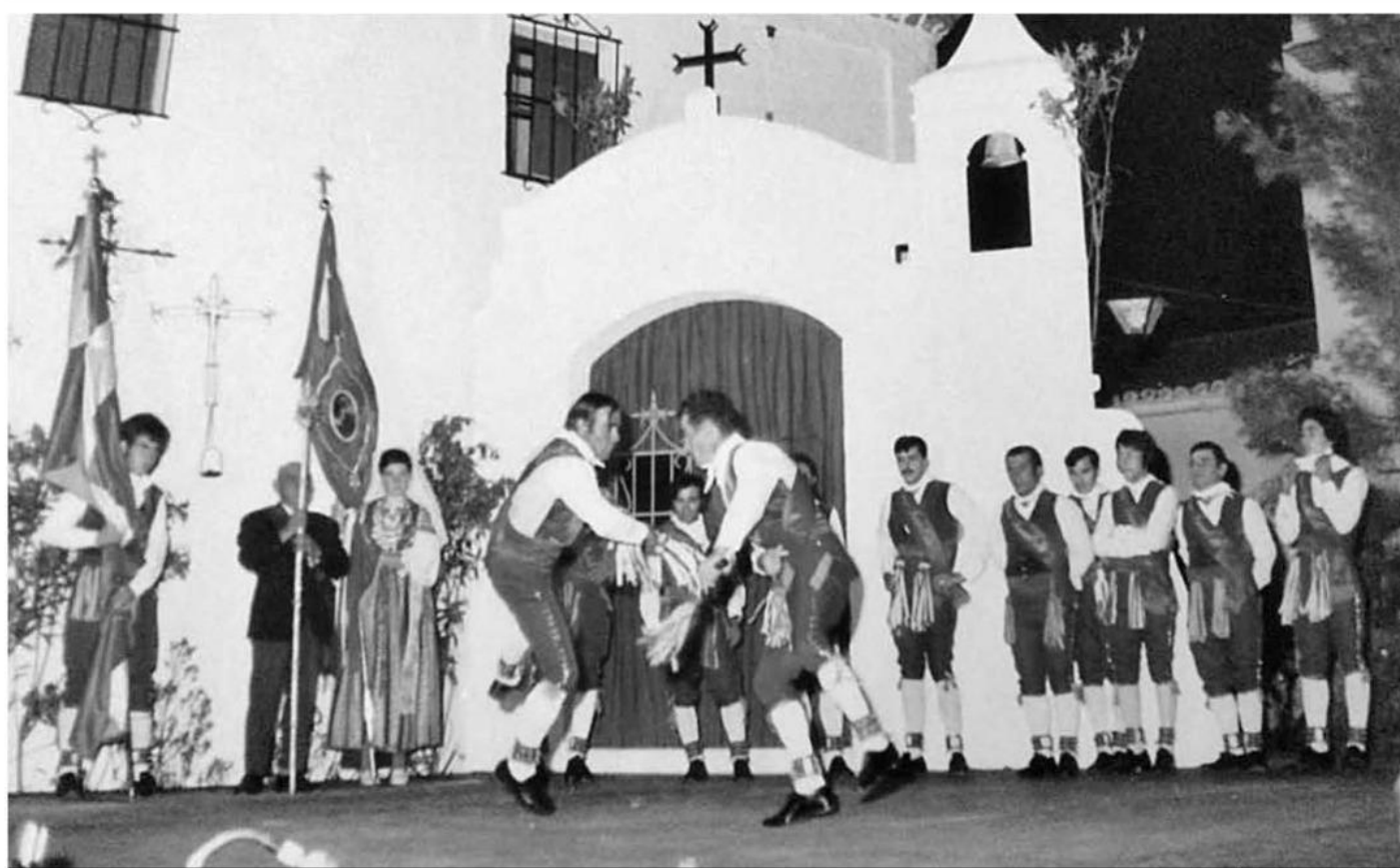
Danza del Fandango Parao que se interpretó en 1974.

ALOSNO | LOS INICIOS DEL CERTAMEN REGIONAL DE DANZAS