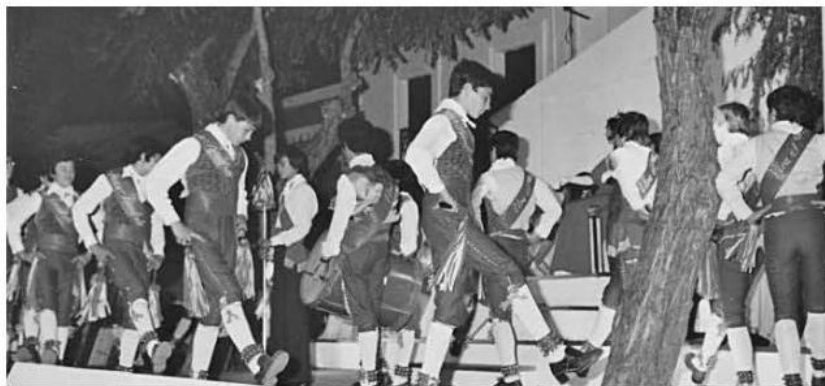
Danza de Los Cascabeles. Coro Infantil 1976.