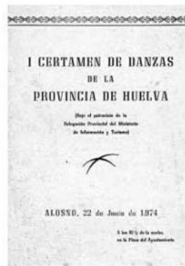
Cartel de 1974.