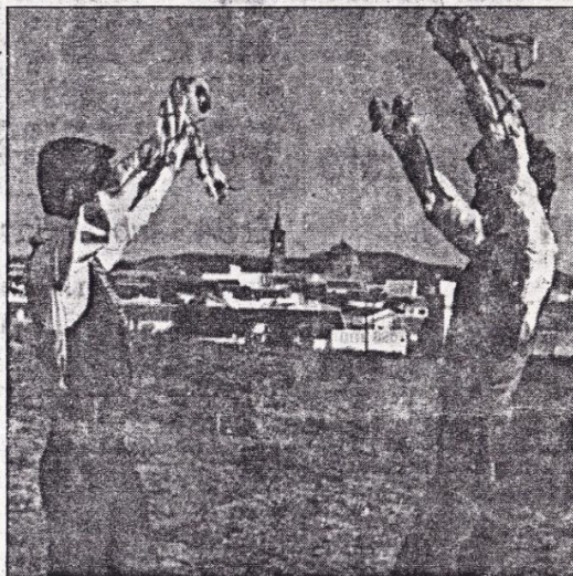
H. INFORMACIÓN Los cascabeleros de Alosno pondrán una nota de color en la ceremonia.

Según los estatutos de la Hermandad de San Juan Bautista, la danza no puede intervenir en actos lucrativos o de lucimiento a modo